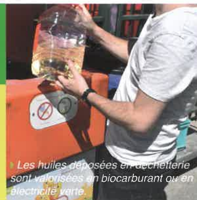
Les huiles déposées en déchetterie sont valorisées en biocarburant ou en électricité verte.

Pour vous débarrasser de vos huiles de cuisson, il suffit de les verser dans un récipient adapté (comme leur emballage d'origine par exemple) et de les déposer dans les bornes présentes dans toutes les déchetteries du SIETREM. Attention, la réglementation interdit de verser les huiles de friture dans votre évier. En plus de nuire à l'environnement, ce geste pourrait encrasser et obstruer vos canalisations.