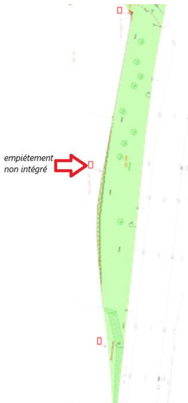
Figure 3 : exemple d'un empiètement non intégré dans le plan d'alignement